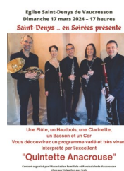
Vous découvrez un programme varié et très vivant interprété par l'ensemble "Quintette Anacrouse"

Dimanche 17 mars 17h à St Denys Quintette « Anacrouse »